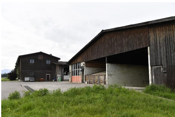
Stall und Remise