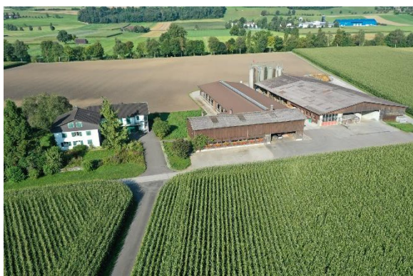
Wohnhaus, Mastställe, Remise