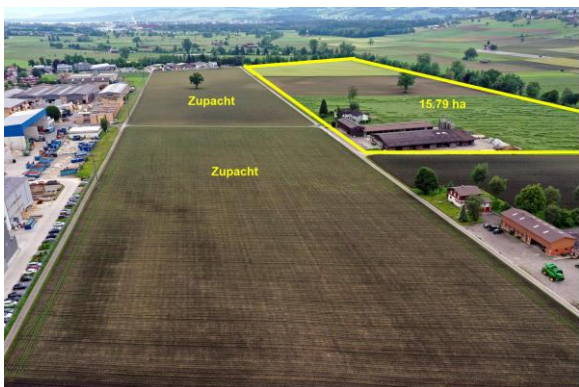
Zupachtland (links), rechts oben Hofparzelle