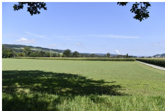
Hofparzelle mit Zufahrtsstrasse