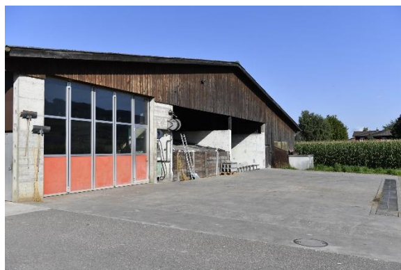
Remise mit Werkstatt, Tanklager, Fahrsilos